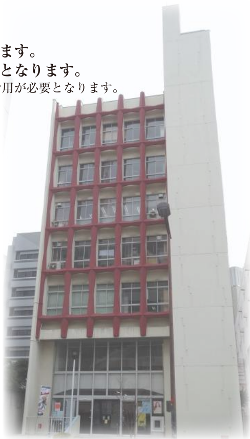
大阪府電気工事技術会館 昭和45年9月1日竣工