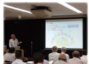
スキルアップ研修会