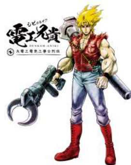
大電工キャラクター「電工兄弟」