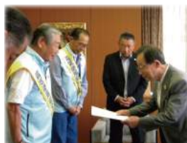
市町村訪問キャラバン