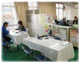
大電工本部2階にある 免状交付・業登録センター

大阪府の委託を受け平成28年4月より、大電工本部2階事務所で窓口業務を行っております