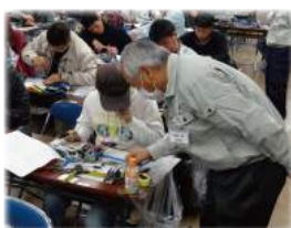
第一種電気工事士技能試験 受験対策講習の様子

第二種電気工事士技能試験受験対策講習や1級電気工事施工管理技術講習会など支部にて開催している講習会もございます。詳しくは事務局までお問い合わせ下さい