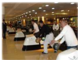
支部スポーツ大会